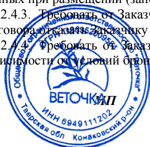
Д. Б. Саломатин (И. О. Фамилия)

2.4.4. Требовать от Заказчика оплаты первых суток проживания или полной стоимости произведенного заказа, в зависимости от условий бронирования отеля.